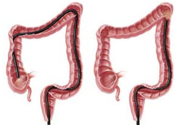
Схема продвижения колоноскопа по толстой кишке